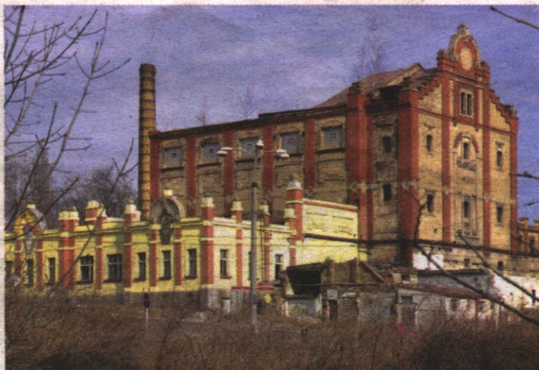
Měšťanský pivovar v Chomutově přestal vařit pivo v roce 1952. V roce 2011 ho demoliční stroje srovnaly se zemí.

Pivo by se mělo začít vařit koncem roku. „Pro začátek by se vařila